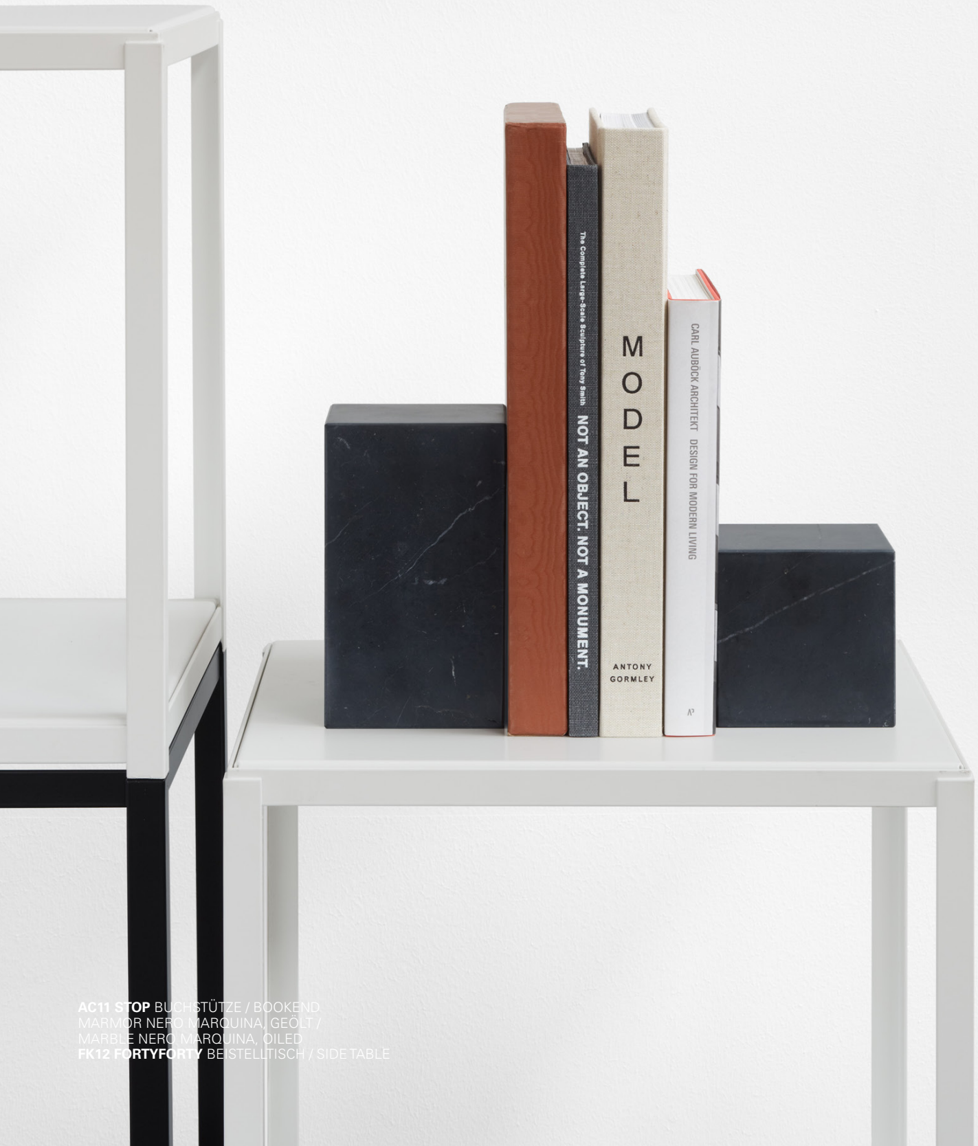
AC11 STOP BUCHSTÜTZE / BOOKEND MARMOR NERO MARQUINA, GEÖLT / MARBLE NERO MARQUINA, OILED FK12 FORTYFORTY BE STELLTISCH / SIDE TABLE