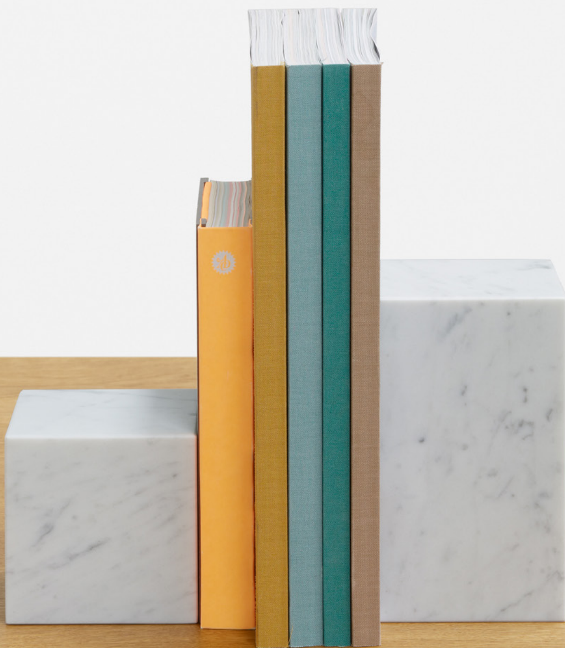
AC11 STOP BUCHSTÜTZE / BOOKEND MARMOR BIANCO CARRARA, GEÖLT / MARBLE BIANCO CARRARA, OILED