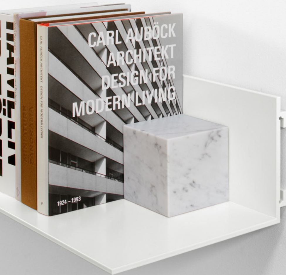
AC11 STOP BUCHSTÜTZE / BOOKEND MARMOR BIANCO CARRARA, GEÖLT / MARBLE BIANCO CARRARA, OILED SH06 PROFIL REGAL / SHELF