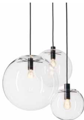
Metall pulverbeschichtet schwarz Metal powder coated in black